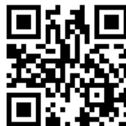
図 2 リンク

山の特別展では、展示パネルに二次元バーコードを印刷し(図 3)、YouTube にある山の VR 動画へ観覧者が容易にアクセスできるように工夫した。二次元バーコードを活用し、VR 動画とリンクさせることで、来館者に対し三次元の山の体験ができるようになった。