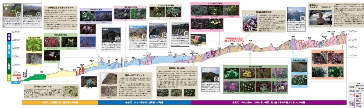
図 3 二次元バーコードを活用した山の特別展展示パネル