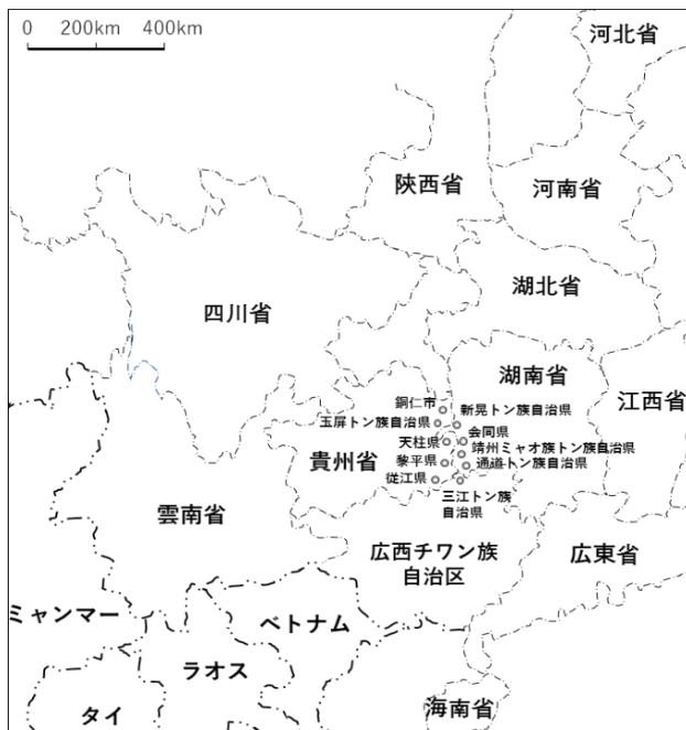
トン族の居住地（中国貴州・広西・湖南の境界地帯）